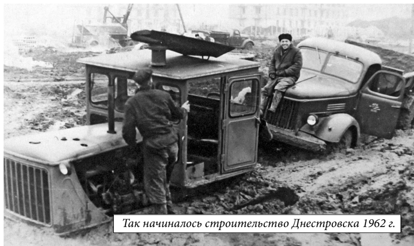
Так начиналось строительство Днестровска 1962 г.