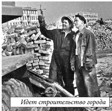
Идет строительство города