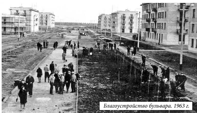
Благоустройство бульвара. 1963 г.