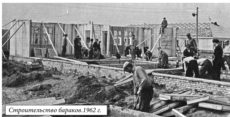
Строительство барак. 1962 г.